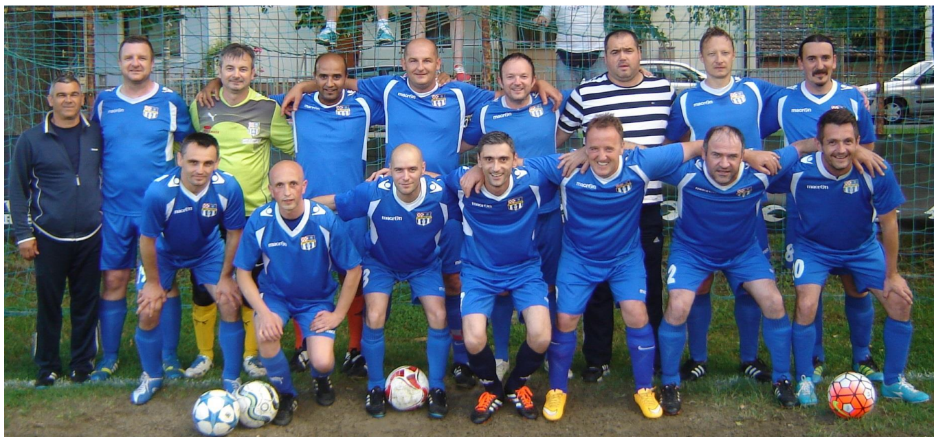
SRD Trnava, Veterani (Zagreb) Prvaci, 1. liga skupina B, 47. prvenstvo veterana ŽNS (sezona 2015 / 2016)

1. liga skupina B ( povjerenik Luka LUKIĆ; 099 8362026; lukic13luka@gmail.com ):