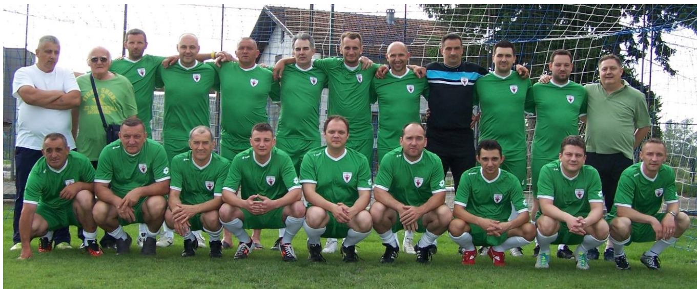
NK Mladost Buzin, Veterani (Zagreb) Prvaci, 2. liga skupina C, 47. prvenstvo veterana ZNS (sezona 2015 / 2016)

2. liga skupina C ( povjerenik Đuro DRAGIĆ, 091 6570484; dj.dragic@gmail.com ):