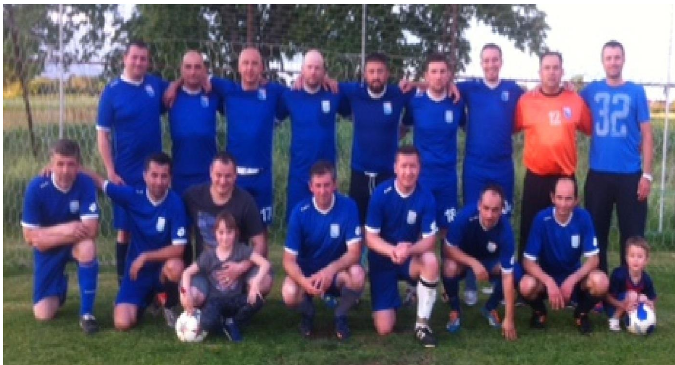
NK Polet, Veterani (Zagreb, Sveta Klara) Prvaci, 1. liga skupina A, 47. prvenstvo veterana ZNS (sezona 2015 / 2016)